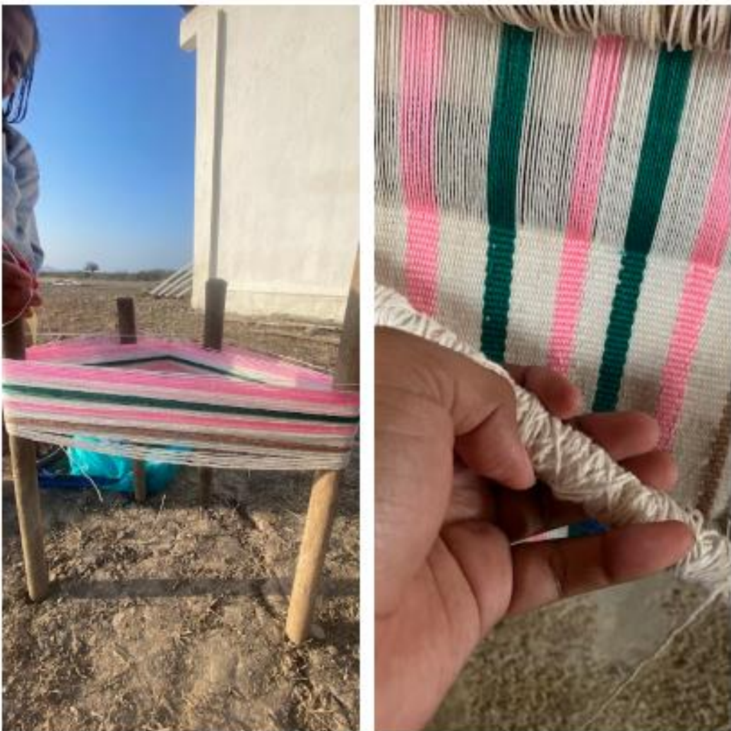
Fig. D Urdimbre de hilos y tejido en elaboración

Este estudio etnoarqueológico ha permitido registrar y comparar las técnicas de manufactura textil actuales con las de la época prehispánica. El algodón, como materia prima esencial y manifestación cultural en ese período, resalta su relevancia en el valle de Chanduy. Aunque la elaboración textil se mantiene principalmente en el ámbito doméstico, es probable que hayan existido áreas específicas para su producción en el valle que aún no se han localizado. A pesar de que el cultivo de algodón es actualmente escaso, la importancia de esta planta se evidencia en la iconografía de los textiles documentados en las comunas de Tugaduaaja y Pechiche.