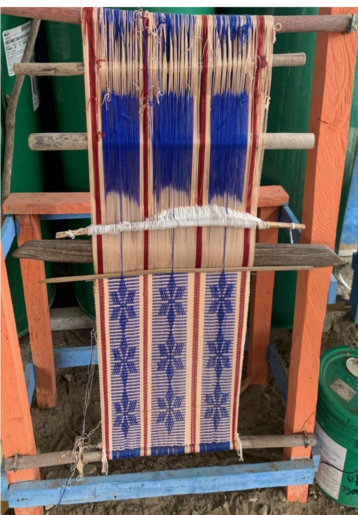
Fig. C Telar vertical perteneciente a Germania Pita, maestra artesana